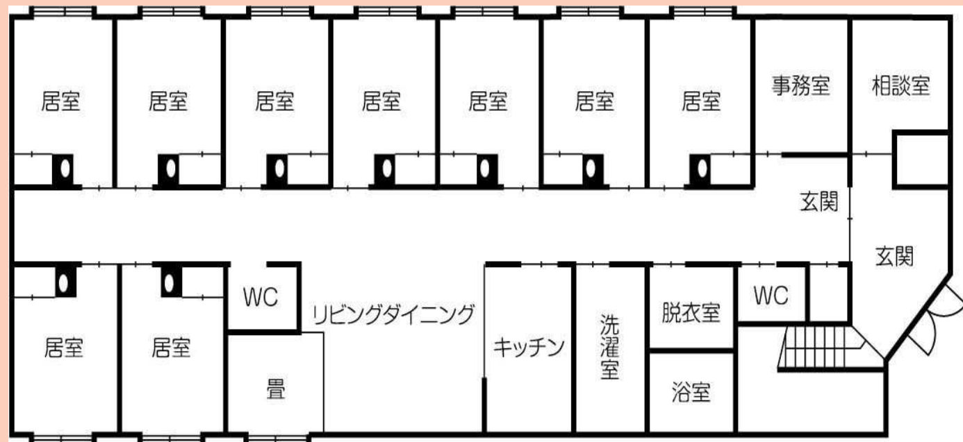
～グループホームせいろう 見取り図～